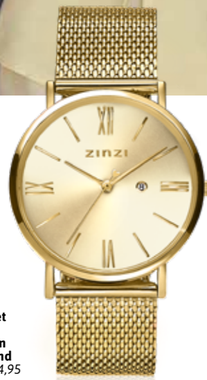
ZIW 510M watch 34mm 'Roman Gold' 119.-*