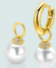
ZICH 2823Y oorbedels 8mm 29.95 p.pr