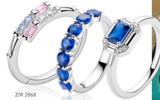
ZIR 2868 59.95