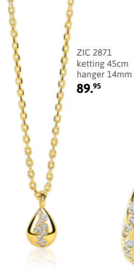
ZIC 2871 ketting 45cm hanger 14mm 89.95