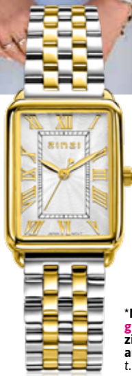
ZIW 1907 watch 28mm 'Elegance Bicolor' 149.-*