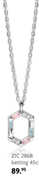
ZIC 2868 ketting 45cm 89.95