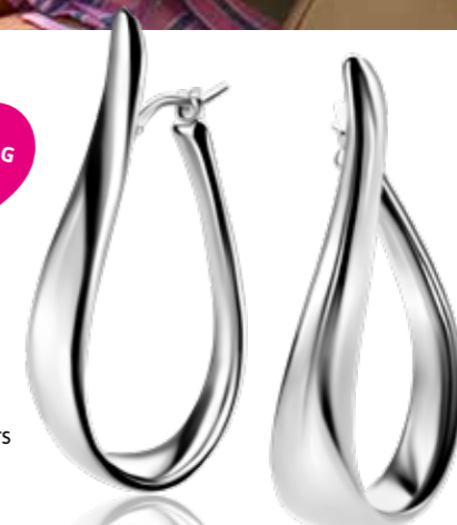
ZIO 2675 | 49mm oorsieraden Nú 99.95

EYE CATCHERS Opvallend mooi zijn deze grote oorsieraden in organische vorm. Mooie eyecatchers voor de lente.