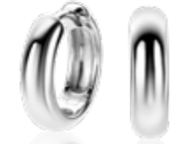
ZIO 2565 oorringen 15x4mm 59.95