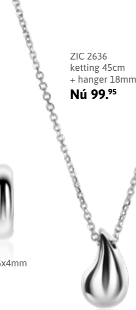
ZIC 2636 ketting 45cm + hanger 18mm Nú 99.95