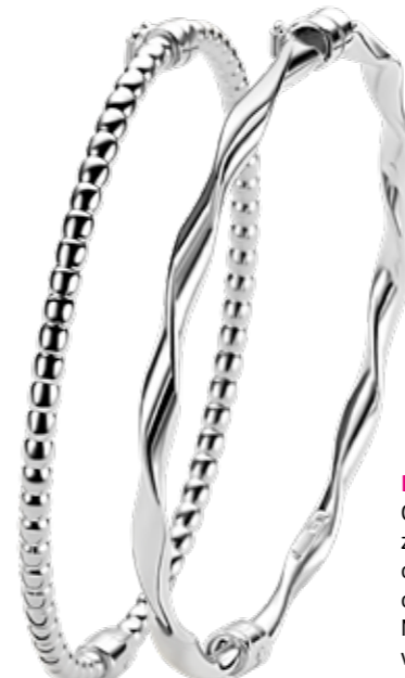
ZIA 2755 bangle 3mm 129.95

Waardevolle sieraden van écht zilver en zilver gold plated!