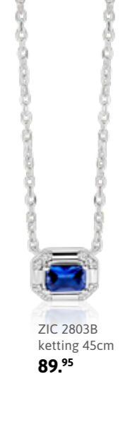
ZIC 2803B ketting 45cm 89.95