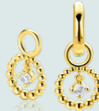
ZICH 2816 oorbedels 10mm 42.95 p.pr