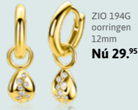
ZIO 194G oorringen 12mm Nú 29.95