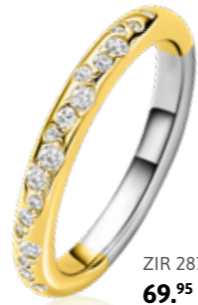
ZIR 2871 69.95