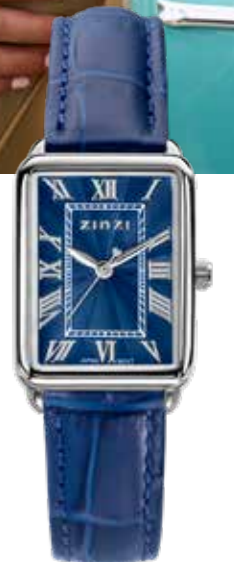
ZIW 1955B watch 28mm 'Elegance Blue' 119.-*