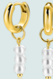
ZICH 2734Y oorbedels 18mm 34.95 p.pr