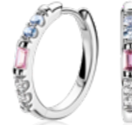
ZIO 2868 oorringen 19x2mm 64.95

VROLIJK GEKLEURD Deze zilveren sieraden geven je outfit meer kleur. Schitterend bezet met blauwe of roze kleurstenen. Of kies voor een trendy organische vorm. Een stoere combinatie!