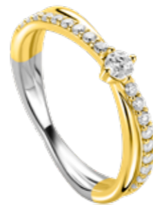
ZIR 2725Y 59.95

GOLD PLATED Zilveren sieraden in geelvergulde: het zilver is voorzien van een heel dun laagje 14k gold plating.