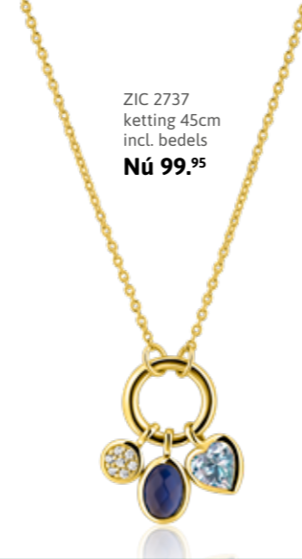
ZIC 2737 ketting 45cm incl. bedels Nú 99.95

VROLIJK GEKLEURD Deze zilveren sieraden geven je outfit meer kleur. Schitterend bezet met blauwe of roze kleurstenen. Of kies voor een trendy organische vorm. Een stoere combinatie!