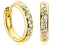
ZIO 2871 oorringen 15x3mm 69.95

COOLE DRUPPELS Heerlijk schitteren met deze hippe items. De witte zirkonia's zijn als druppels verwerkt in de sieraden en geven je look net dat beetje extra.